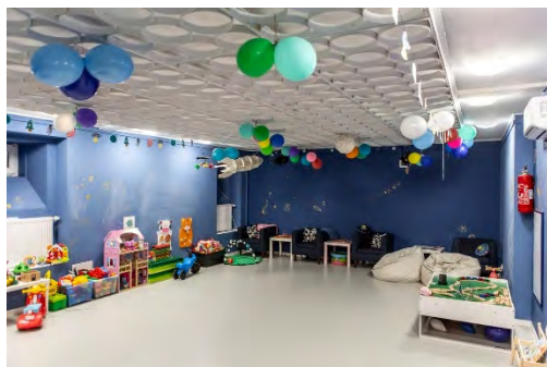
Sala zabaw Kosmos